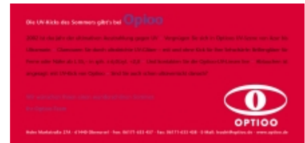
Umschlag, Mailingkarte und UV-Meßwertkarte